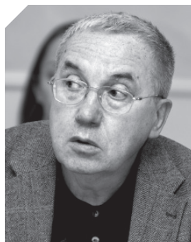
Андрей Кокошин, депутат Государственной думы РФ, член Правления ИНСОР