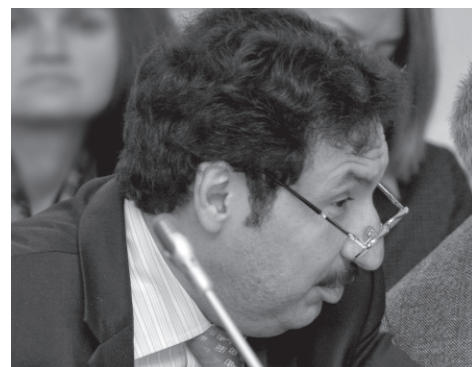
Владимир Мау, ректор Академии народного хозяйства при Правительстве РФ, член Правления ИНСОР

Ректор Академии народного хозяйства при Правительстве РФ, член Правления ИНСОР Владимир Мау озвучил некоторые результаты сентябрьского опроса предприятий, проведенного Институтом экономики переходного периода. Они позволяют сделать вывод о том, что кризис уже перекинулся на реальный сектор эконо-